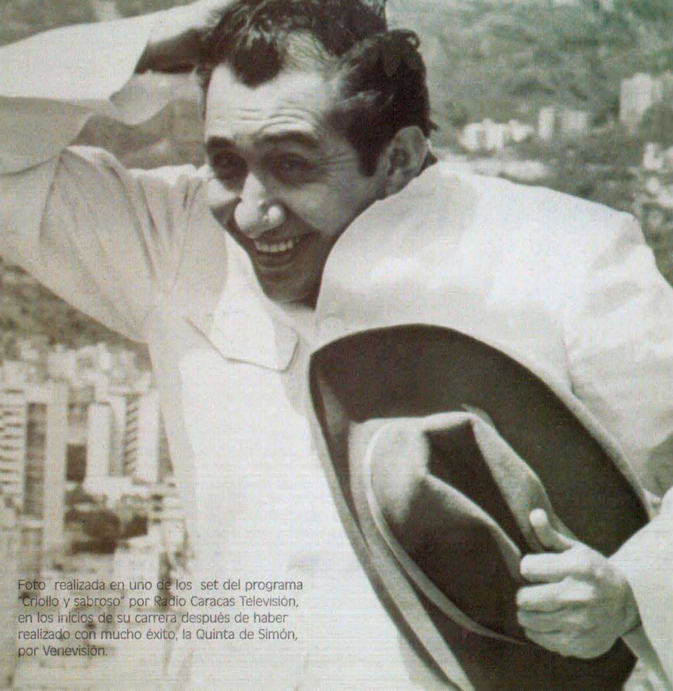
Foto realizada en uno de los set del programa "Criollo y sabroso" por Radio Caracas Televisión, en los inicios de su carrera después de haber realizado con mucho éxito, la Quinta de Simón, por Venevisión.