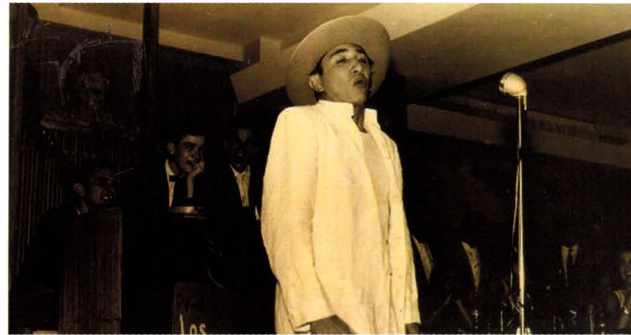
Curiosa foto en los inicios de su carrera en 1963. Fue en El Hotel Excelsior de Valencia donde fue contratado como humorista. En esta oportunidad alternando con la Orquesta Los Makers.